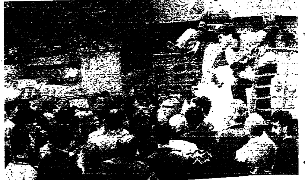
توزيع المساعدات في شارع غنوم في عين الرمانة